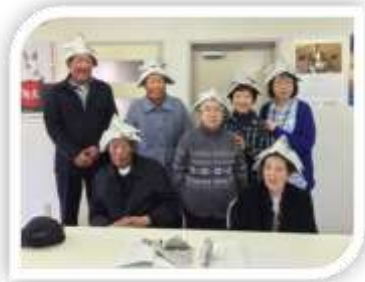
手稲区前田「移動教室」