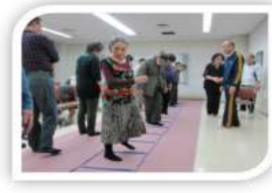
厚別区もみじ台「介護予防サロン」